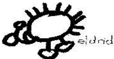
Afbeelding 1: De muis heeft een pluus.

De kinderen van groep 1 van Votum Nostrum hebben tijdens de kinderboekenweek rijmpjes gemaakt over dieren.