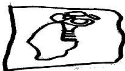
Afbeelding 4: De hond zit in zijn blote kont