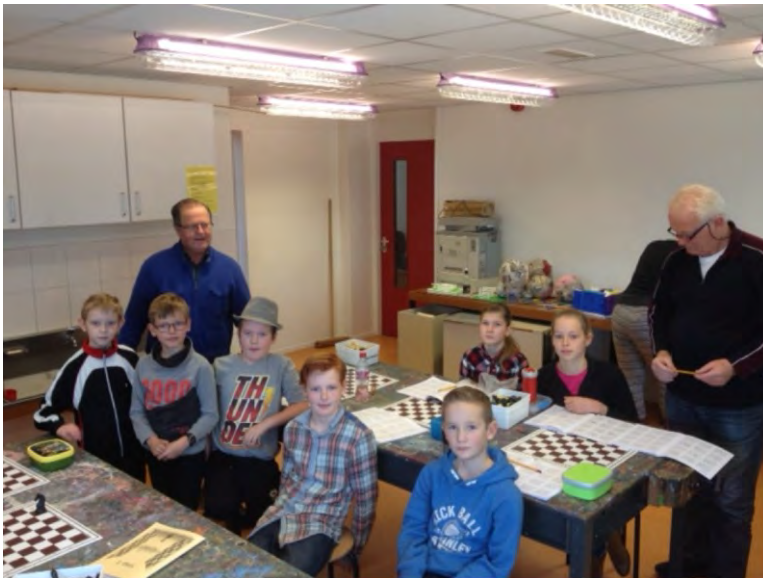
De schaakploeg van beide scholen

Voor het schooljaar 2015-2016 is er een voorstel gedaan om een thema- of projectweek voor te bereiden die we met elkaar kunnen uitvoeren en eventueel aan elkaar kunnen laten zien. November en december zijn spannende maanden voor de kinderen. Nog niet lang geleden liepen de kinderen met hun lampion door de straten om bij elke deur te zingen voor tasvulling. Al dit lekkers met kleur- en zoetstoffen moest